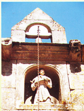
Capela en Conso