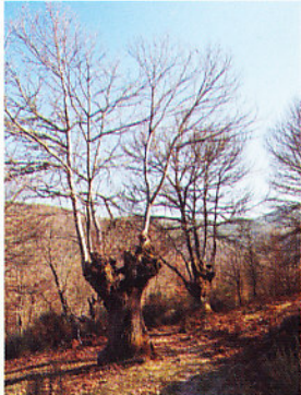
Castiñeiro ( Castanea sativa ) sen follas en inverno