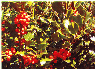
Acivro ( Ilex aquifolium )